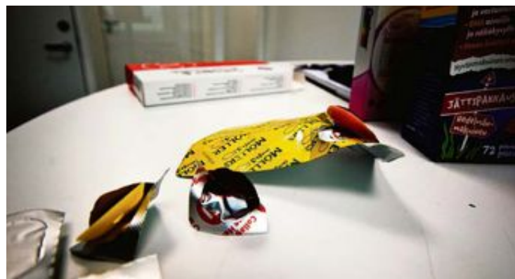
GELÉFISKER FRA ORKLA: Kosttilskuddet produseres av Vitux på en fabrikk i Troms.

kapasiteten takket være kjøp av produksjonsutstyr, tanker og pakkemaskiner, sier Neumann.